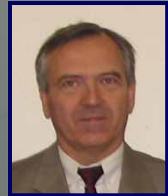
Pierre Garrec Direction