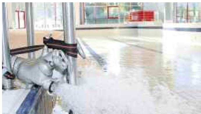
Tout un symbole. La remise en eau d'Aquabaie après un an de fermeture. 3 000 m 3 vont être déversés dans les bassins.