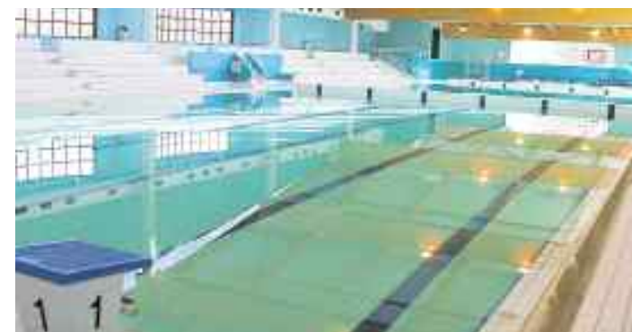
Aquabaie revient à 1 520 €/m 2 . « Soit moins que beaucoup de piscines neuves construites actuellement qui avoisinent autour de 2 000 € », assure Alain Cadec.