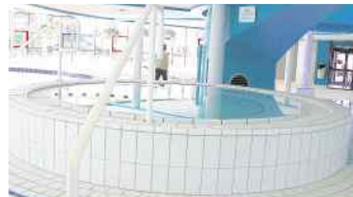
Profitant du chantier, des travaux d'amélioration ont été réalisés. L'accès au spa a, par exemple, été facilité.